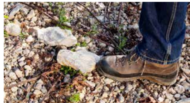
Alle Rebstöcke unserer klassischen Lagenweine wachsen auf Wellenkalkterroir.