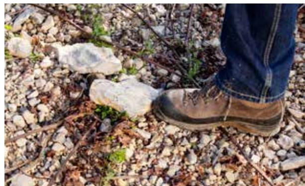
Alle Rebstöcke unserer klassischen Lagenweine wachsen auf Wellenkalkterroir.